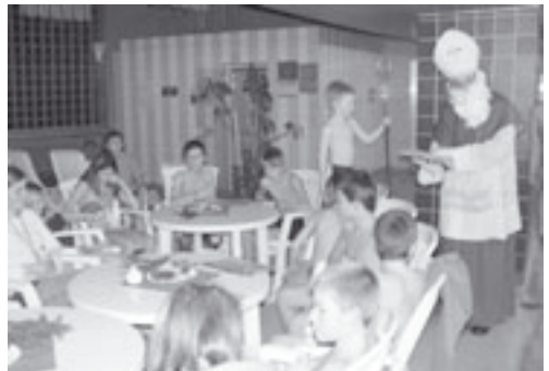
der Nikolaus mit seinem dicken Buch