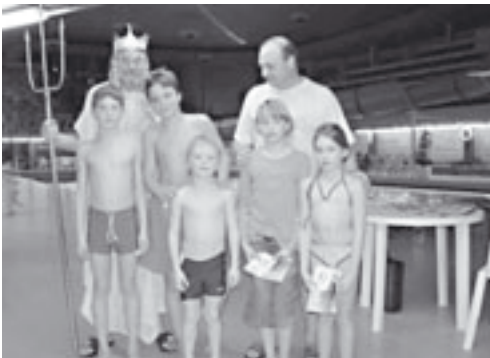
unsere neuen Otterkinder Vereinsmeister 2003

Unser diesjähriges Nikolaustraining wurde vorwiegend von zwei besonderen Herren gestaltet. Zuerst konnte „König Triton“ un-