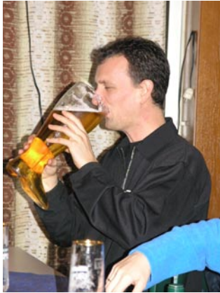
Sandra Daniel Redaktion

Es wurde sogar ein Weihnachtsbaum im Sprungbecken versenkt und mit allerlei „Flüssigkeiten“ geschmückt. Von der gegenüberliegenden Seite antauchen bekamen dann die Mitglieder die Gelegenheit, sich eine wunderbare Köstlichkeit vom Baum zu angeln. Unter todesmutigem Einsatz der Redaktion gelang es mir, auch ein solches Fläschchen zu ergattern. Weiterhin gab es noch allerlei amüsante Spielchen, bei denen die Marlins ihr Geschick, ihre Kondition und ihre gute Lunge beweisen mussten.