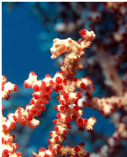
Pygmäen Seepferd / Philippinen 2007