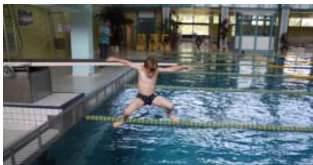
Die Kids waren in der Pause mit Eifer und Freude im Wasser und ließen keinen Moment aus, vom 1-m-Brett zu springen.