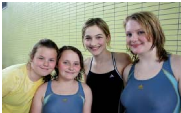
Teamgeist wird bei den Turtles groß geschrieben

Insgesamt war die Jugend der Turtles also mit 17 Teilnehmern vertreten.