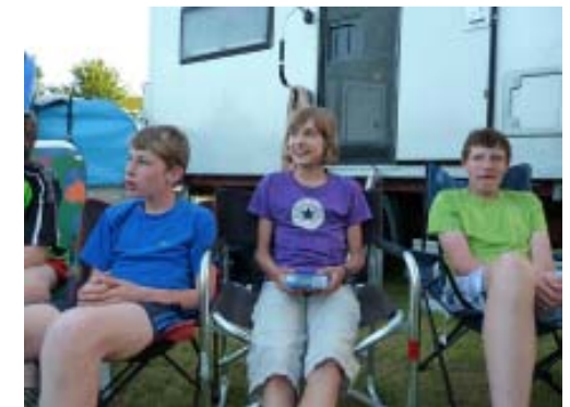
die hier in der Mitte mit ihrem Preis sitzt