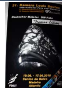
Foto unten rechts: eines der 10 Bilder aus dem Wettbewerb vom Deutschen Meister Thomas Lücken