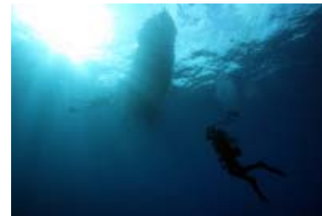
Foto links: Ludwig Migl und Model Antje Winkler in Aktion