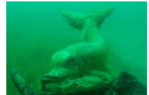
und dies ist sein Siegerfoto