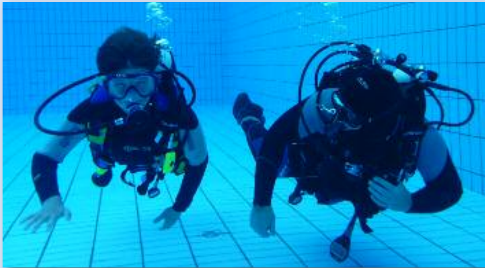
Gemeinsame Aktion des TC Manta und des TC Heusweiler

Wir sind dabei! hatten der TC Manta Saarbrücken und der TC Heusweiler als Devise für den VDST Tauchertag ausgegeben. Und so war es auch. Taucher beider Vereine trotzten Wind und Wetter, um am 24.6.2012 von 13 bis 16 Uhr den mutigen Schnuppertauchern den Spaß am Tauchen zu vermitteln. Es ist ihnen gelungen: Kinderaugen strahlten, pausierende Taucher haben die Lust am Sport wieder bekommen, der älteste Schnuppertaucher senierte darüber, wie man sich das Tragen der Ausrüstung vom Auto zum Einstieg erleichtern könnte und freut sich über sein nächstes Schnuppertauchen im Mittelmeer, der Jüngste freute sich ein-